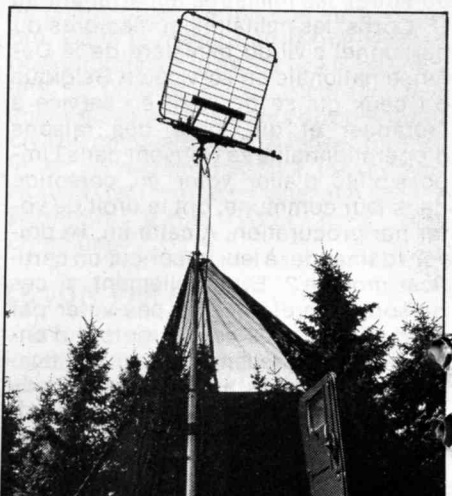
L'ANTENNE DU « MRC-8 », LA DERNIERE VENUE DU LOT DES CABINES DE CABLES HERTZIENS, ATTIRE L'ATTENTION.

antennes. La seconde aire, « Whisky », est occupée par les radios à basse fréquence; pour son emplacement, un point culminant a été choisi également. La troisième aire (« Ops ») est plus étendue que les deux précédentes car la « grosse » partie du charroi y est installée notamment les camions équipés des téléimprimeurs, du central, du matériel de test et de réparation, etc... Sur cette zone d'exploitation du système se trouve aussi le poste de commandement (Cie et Bn). Enfin, la quatrième aire est réservée à l'administration et aux services de logistique (réfectoire, cuisine, logement...). Entre ces aires se déplace le peloton de construction de lignes.