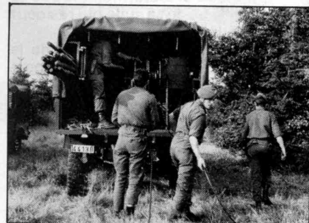
PARTANT DE « CHARLY », LES CABLES SONT TIRES EN DIRECTION D'« OPS ».