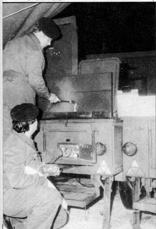
▲ LE SITE DE L'EGGEGBIRGE DEVAIT S'OCCUPER DU RAVITAILLEMENT DU 6TTr ET DE SES VISITEURS : AU MENU, DES SAUCISSES, OU LA GASTRONOMIE EN CAMPAGNE !

Dès notre arrivée à la caserne d'Arolsen, nous fûmes dirigés par le lieutenant-colonel Hamel, adjoint du CTr (commandant des Troupes de transmission), vers le PC du 6ème Bataillon à environ 40 km au nord d'Arolsen. En effet, c'est à Willebadessen que ces troupes étaient en train d'aménager leurs installations, car ils avaient quitté leurs positions sur le Rhin à cinq heures du matin. Dans l'après-midi, tout était prêt, et ce "jump" fut certes un bel exemple de rapidité et d'organisation.